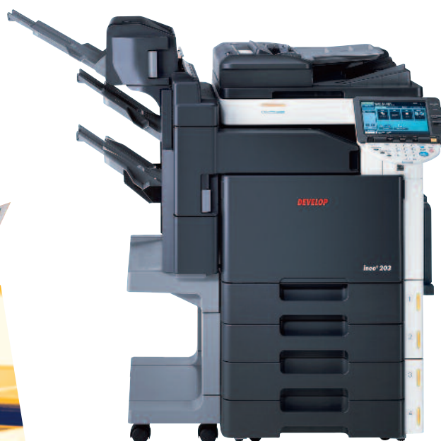
ineo+ 203 avec chargeur automatique de documents (DF-611), module de finition embarqué (FS-519), kit brochure (SD-505) et deux magasins papier (PC-204)