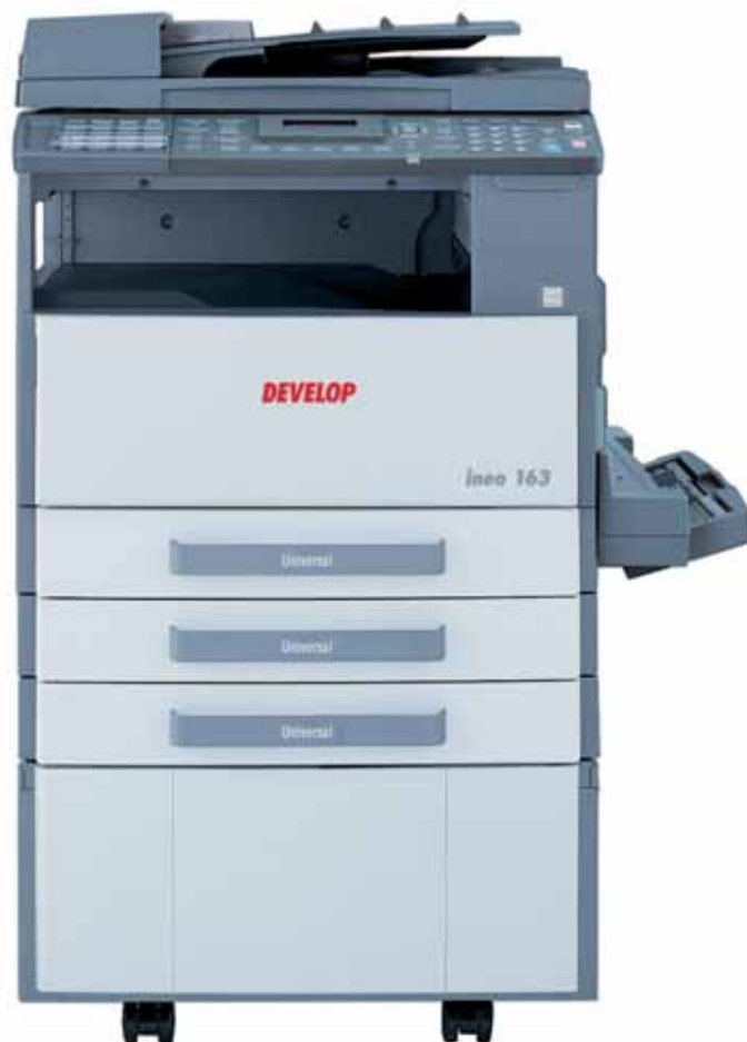
ineo 163 avec chargeur automatique de documents DF-502, multi-bypass MB-501 et petit magasin SCD-21 équipé de deux magasins papier PF-502.

Les PME/PMI, les utilisateurs de copieurs analogiques ou d'imprimantes jet d'encre, recherchant à la fois davantage de fonctionnalités ainsi qu'un gain de temps, d'espace et d'argent trouveront réponse à leurs exigences ; les administrateurs souhaitant mettre en place l'impression et la numérisation en réseau ou encore les entreprises de taille moyenne nécessitant plus que le traditionnel format A4 auront comme solution l'ineo 163/213. Ce système multifonction offre à tous une valeur ajoutée pour un coût modéré.